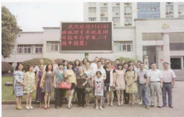
916101班地理专业校友合照