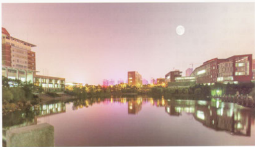
月满云塘

在广玉兰上的尘埃，让玉兰的洁白在雨露下更透彻。当五月接近尾声，玉兰的香将在六月继续蔓延。盛夏来临之前，玉兰将陪伴我们走过这漫长的雨季。刻玉玲珑，吹兰芬馥，广玉兰，以它特有的洁白清香守护着烟雨笼罩下的云塘。