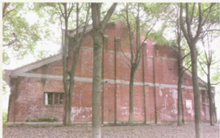
东苑大礼堂老房子照片（一）