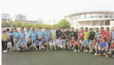
校友们举行足球比赛增进感情