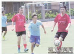
城南学院2003级“城南足球梦一队”校友 与城南在读学生举行足球PK比赛