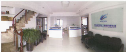
广东金天擎化工科技有限公司

【公司简介】广东金天擎化工科技有限公司为当今全球最高车速纸机开机化学品——杀菌剂、消泡剂供应服务商。公司成立于2006年，注册资金1000万。经过近十年的发展，广东金天擎化工已经成长为中国造纸化学品应用服务领跑者，产品涵盖造纸、工业循环水、毛纺、皮革、涂料、日化等诸多领域，仅造纸助剂现有六大系列几十个品种，缩小了中国在这一行业与世界的差距。