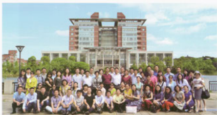
财经91级校友毕业二十周年合影留念