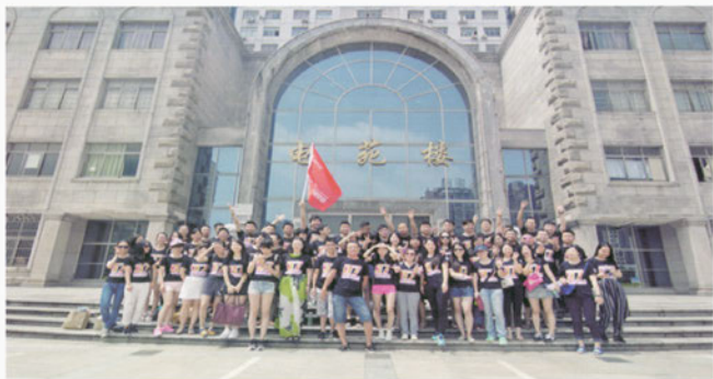
长沙理工大学城南学院07级艺术设计专业校友合影