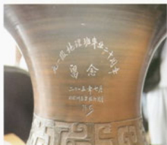
地理916101班同学 向母校捐赠了寓意美好的连升瓶