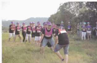
校友们玩游戏增进了解