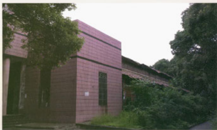
东苑大礼堂老房子照片（二）