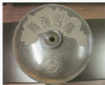
连升瓶顶面的校徽与校训