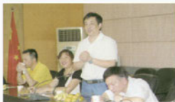
座谈会上，校领导 与老师、校友们愉 快交流