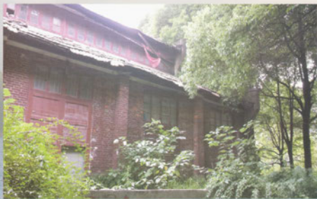
东苑大礼堂老房子照片（三）