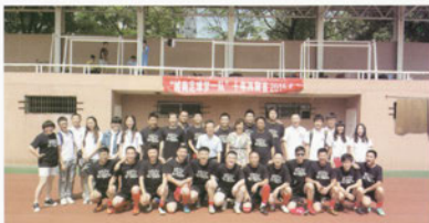
校友与城南学生足球队合影留念