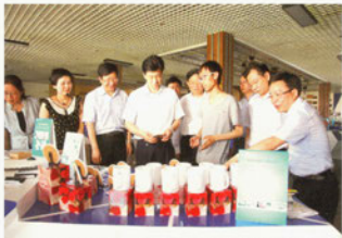
副省长蔡振红一行参观大学生创新创业园

的动手能力、实践能力方面有实效。他希望各高校能进一步加大就业创业相关政策的落实力度，切实抓好离校未就业高校毕业生就业促进计划和创业引领计划的组织实施，提供就业平台，拓展就业渠道，提升就业服务水平。