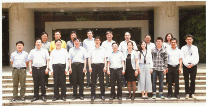
领导与学生代表合影

6月6日上午，湖南省人民政府副省长蔡振红在省政府办公厅党组成员、省政府研究室副主任黎成兴，省人力资源和社会保障厅厅长贺安杰，省教育厅副厅长应若平，省人力资源和社会保障厅副巡视员姚祖清，省政府办公厅秘书六处处长鄢建忠，省就业局副局长王鲁普，省人力资源和社会保障厅就业促进与失业保险处副处长刘曙东，省教育厅学生处调研员周军等一行陪同下，莅临我校调研大学毕业生就业创业工作。校党委书记付宏渊、校长赖明勇及全体在家校领导热情接待了蔡振红一行。