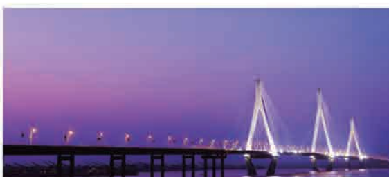
岳阳洞庭湖大桥 项目获评2005年度土木工程詹天佑大奖