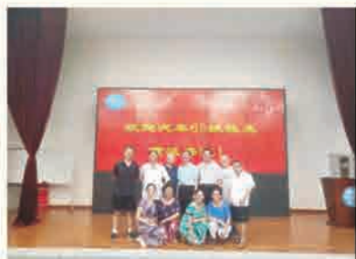
汽车65级校友返校聚会合影