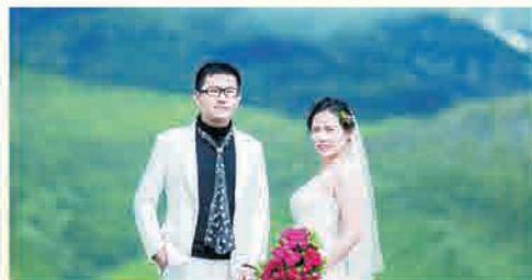
你是我一生最大的幸运