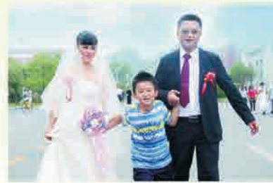
让爱陪伴校友树不断成长