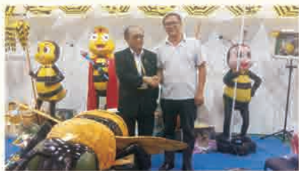
参加第44届世界养蜂大会