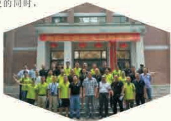
港航93级校友毕业20周年返校聚会合影

座谈会上，校领导、校友中心老师介绍了母校近年来的发展状况，对校友们返校表示热烈欢迎，并对校友们多年来支持母校的发展建设表示诚挚的谢意。校友们纷纷表示，在了解了学校发展史的同时，