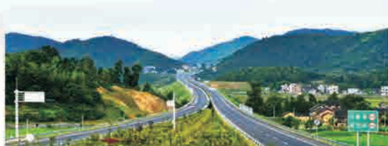
夏蓉高速公路郴州至宁远段

湖南华罡规划设计研究院有限公司成立于1985年，具有独立企业法人资格。公司于2003年12月通过ISO9001质量管理体系认证，现拥有公路行业（公路）专业甲级资质；市政行业（道路工程）甲级资质、工程勘察专业类（岩土工程、工程测量）甲级资质、工程咨询甲级资质，注册资金为人民币600万元，公司拥有职工148人，其中高级职称61人，各类国家注册工程师16人。