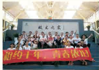
营销03级校友毕业十周年返校聚会合影