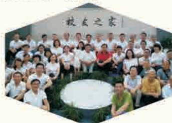
数学87级校友相识30年返校聚会合影

整个假期，校友中心不遗余力地给予校友返校聚会大力支持，搭建母校与校友之间的交流平台，加强母校与校友之间的沟通和联系。校友之家也坚持无假期全年开放，坚持用心服务，得到了校友、师生的一致肯定。