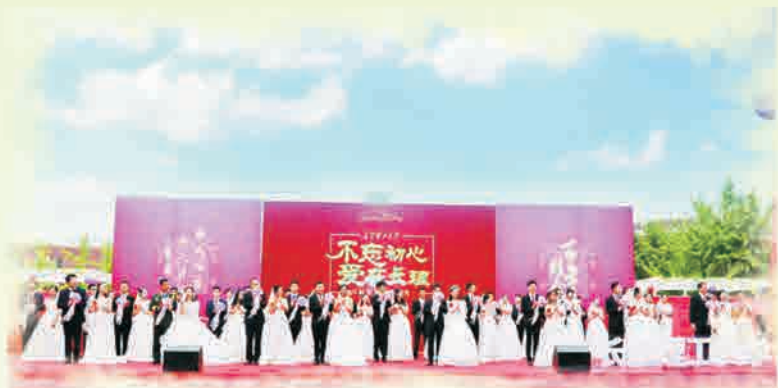
新人放飞承载祝福的心愿气球