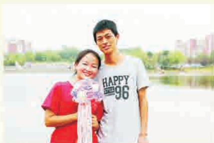
在校情侣抢到象征幸福的捧花