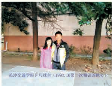
长沙交通学院乒乓球台（1993.10第一次相识的地方）