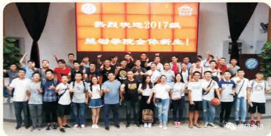
◆ 能动学院组织研究生来“校友之家”体验活动