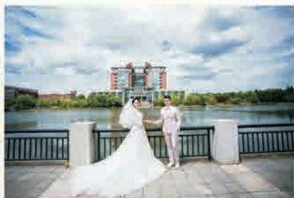
嫁给你，在爱情开始的地方