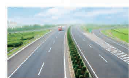
特殊独立隧道专项监理资质 公司参与监理的临长高速公路是湖南省第一条采用沥青混凝土路面和首条实施绿色通道工程的高速公路。项目获评2005年度土木工程詹天佑大奖