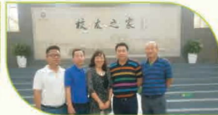
右上：留学生校友来场馆参观 右下：大连校友会骨干代表