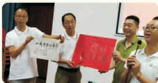
数学87级校友向母校捐赠书法作品并认养校友树