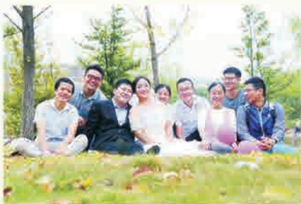
亲友的祝福，为他们的爱情护航