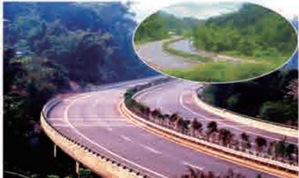
特殊独立大桥专项监理资质 公司参与监理的云南思茅至小勐养高速公路，穿越热带雨林，自然景观与人文景观和谐交融。项目荣获2009年度国家优质工程银质奖及2007年度云南省优质工程一等奖