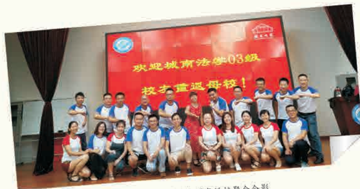
城南法学03级校友毕业十周年返校聚会合影