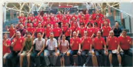
汽运87级校友相识30年返校聚会合影

更感叹于学校现今的巨大变化。回到母校内心无比激动，也为母校今日的成就感到自豪。学校越来越重视校友的成长和发展，返校就像回家一样，今后一定会更加心系母校，常回来看看，尽自己所能为母校的发展建设做出贡献，并在各自岗位继续继承和发扬长理人的“铺路石”精神！