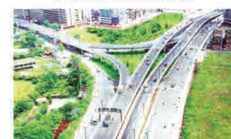
市政工程监理乙级资质 公司监理的广州市中心区交通项目(海印立交)项目获国家优质工程银质奖