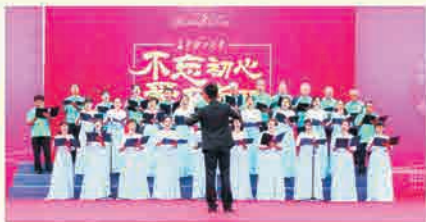
校友合唱团演唱《婚礼进行曲》