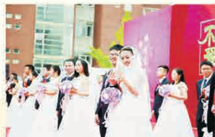
戴上校友对戒，圆下彼此的一生