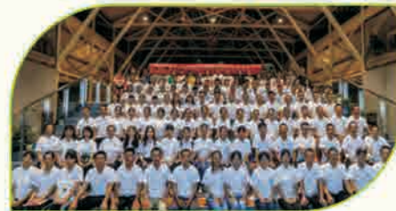
左上：会计0304班 左下：建筑学院2017级新生开学典礼在校友之家进行