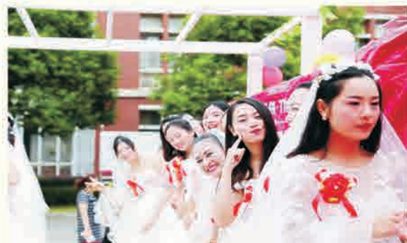
今天我要嫁给你啦